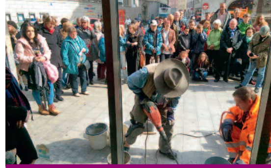
Bei der Verlegung der Stolpersteine in Augsburg