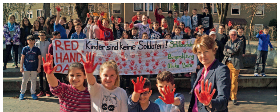
Frieden stiften: RedHandDay in der Schillerschule

Ich will ein europäisches und weltoffenes Deutschland. Als Bundestagsabgeordnete und als Bürgerin trete ich Fremdenhass entschlossen entgegen!