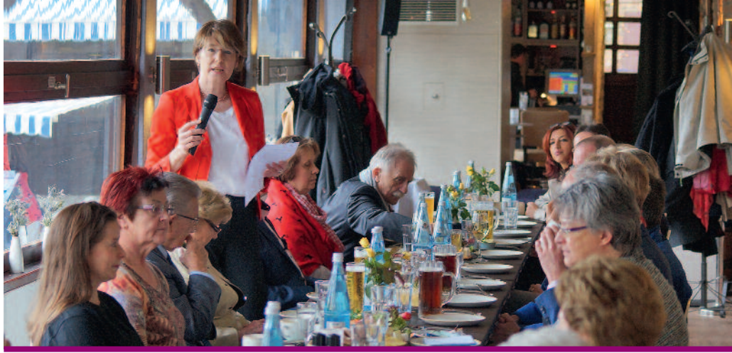
Beim Frühlingsempfang mit vier SPD-Ortsvereinen in der Kahnfahrt