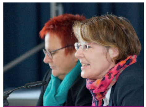
Fachkonferenz mit Staatssekretärin Elke Ferner zum Thema Altersarmut von Frauen