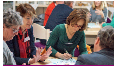
Fachkonferenz zum Sozialgesetzbuch