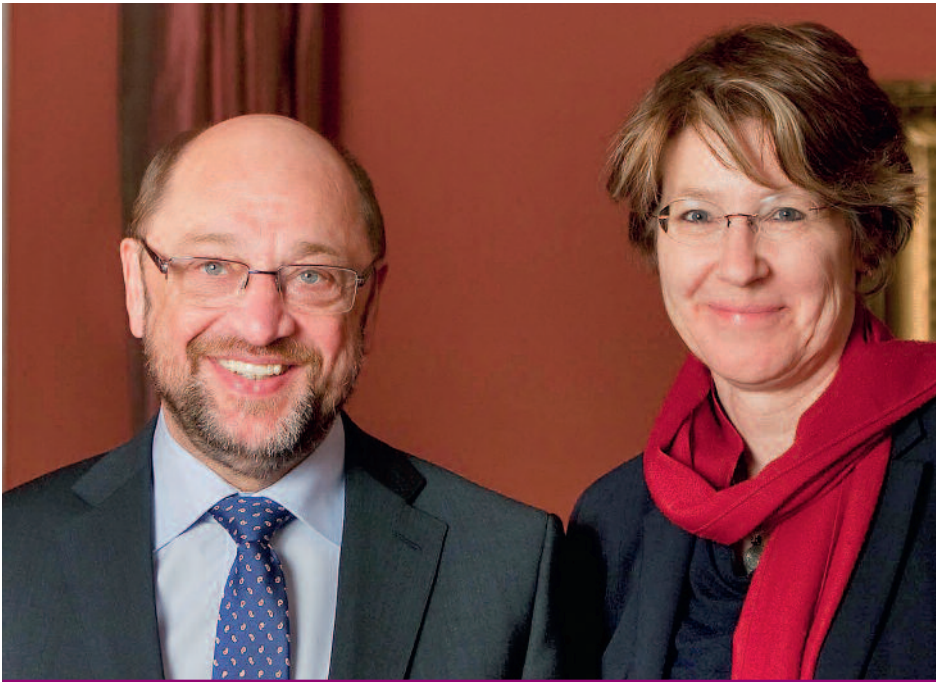
Mit Martin Schulz in Berlin