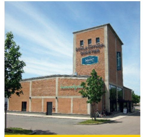
Kesselhaus des Schlachthof-Areals