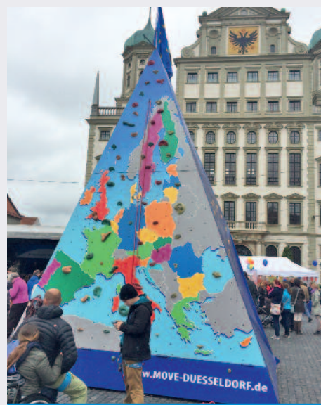
Europa ist vielfältig und bunt

Europatag auf dem Rathausplatz. Die Frage, die immer wieder zu hören war: Ist Europa in Gefahr? Ich glaube nicht. Wir müssen jetzt jedoch die Chance zur Veränderung Europas nutzen. Freiheit, Gerechtigkeit und Solidarität müssen wieder im Mittelpunkt stehen. Für diese Werte gilt es zu kämpfen, sie zu verteidigen. Wenn sich am Ende einige Staaten nicht mehr zum Wertekanon der Europäischen Union bekennen wollen, kann es unter Umständen besser sein, wenn sie gehen. Ein kleineres Europa ist mir lieber, als unsere Werte bis zur Unkenntlichkeit zu beschneiden, nur um alle in der EU zu halten.